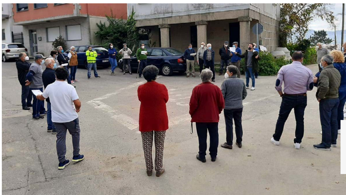
Asamblea vecinal abierta en la propia calle, con miembros del gobierno municipal, en Pontevedra.

Para superar esas reticencias necesitamos de la colaboración, del apoyo y de la plena implicación diversas personas y colectivos vecinales, sociales y profesionales; principalmente aquellos más dinámicos, o más preocupados o necesitados de emplear, mejorar y preservar el espacio público para sus actividades o las de sus asociados, algunos de ellos expulsados del hostil espacio invadido por los vehículos a motor. Si conseguimos que los vecinos y las